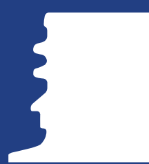
PCO188 - Finish: Short