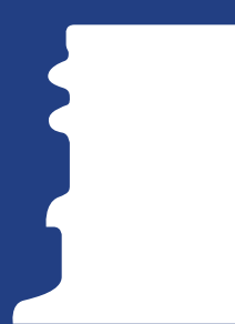
PCO1816 - Finish: Estándar